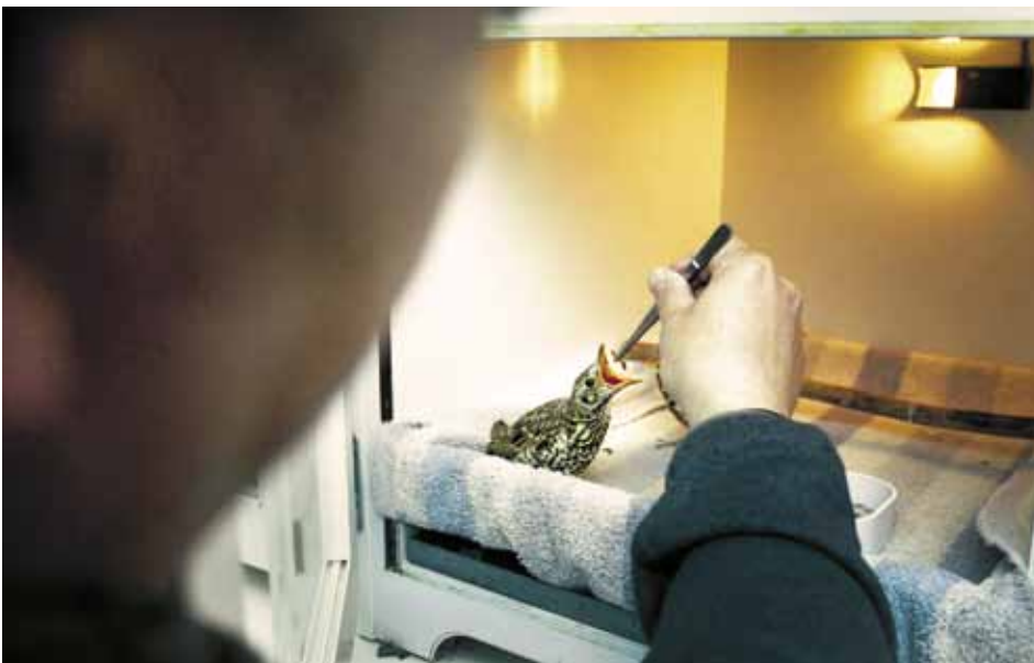
Jonge lijster voeren

▶ MAANDAG, NED 2, 20.55-22.00 UUR (Aansluitend op NPO Doc: Chris Kijne praat met de makers)